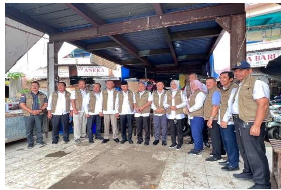
Hasil Pemantauan di Ritel Modern Monev HBKN Puasa Idul Fitri 2024 Provinsi Banten